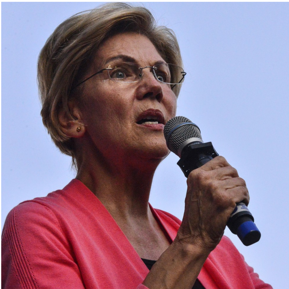
A senadora Elizabeth Warren, pré-candidata democrata à Presidência dos EUA

Foi coincidência o fato de a senadora Elizabeth Warren ter